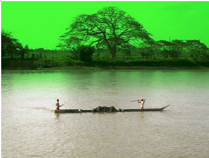
Río Sinú, Departamento de Córdoba, Colombia.